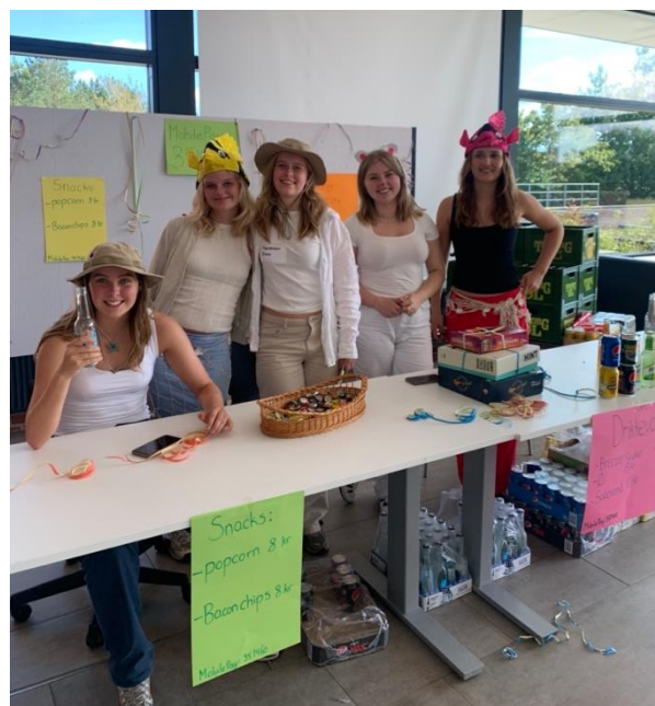
Nogle friske frivillige fra fredagscaféudvalget sælger drikkevarer og snacks.