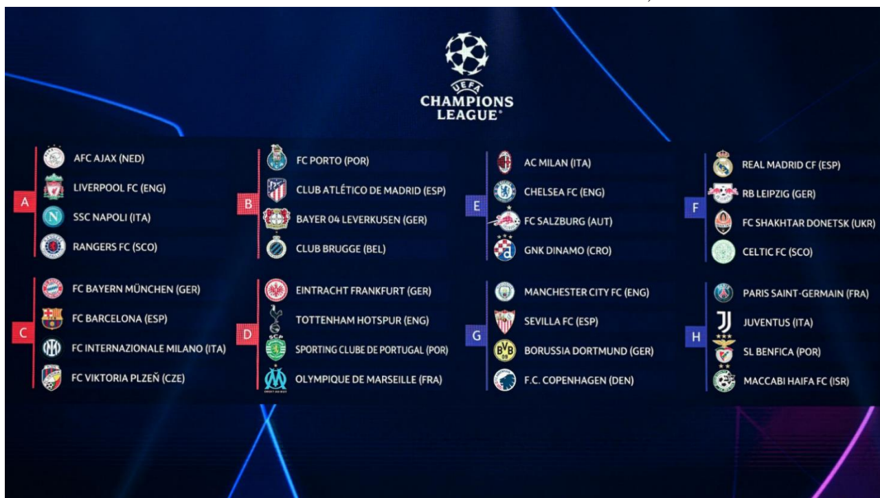
Champions League-udtrækningen for gruppespillet i sæsonen 2022-23.