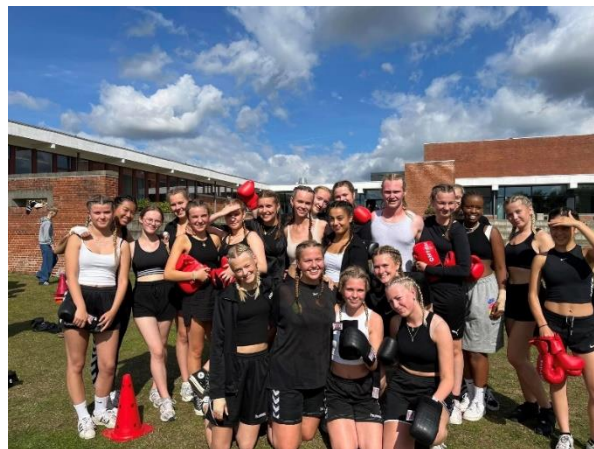
2.a med deres udklædning på

dyster mod hinanden og kæmper i håb om at vinde. Den hyggelige dag slutter, og 2.a vinder prisen for bedste udklædning. Vinderne af de forskellige konkurrencer bliver gf 3.