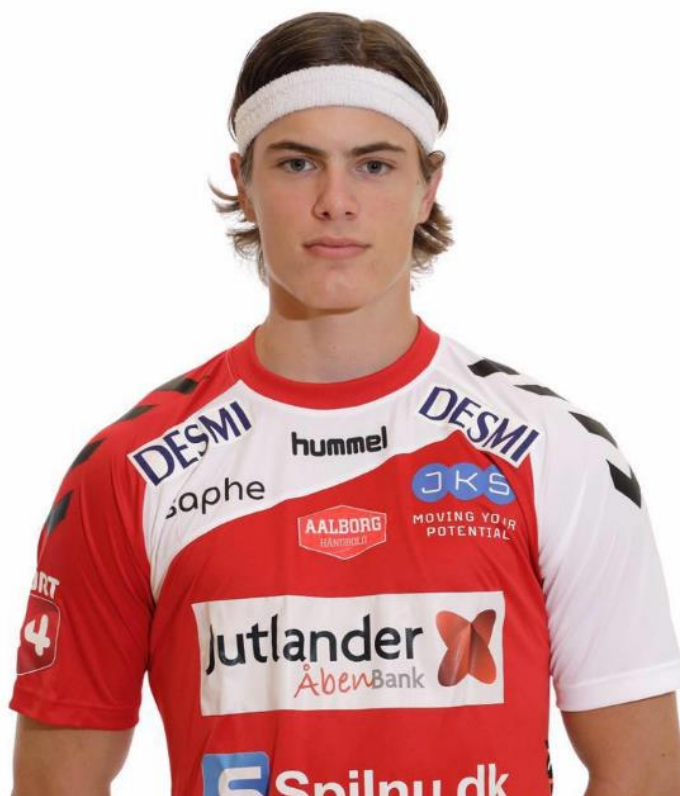
Victors Facebook profilbillede, som er taget for hans klub.

Hvilken klub spiller du for, og hvor ofte træner du Counter Strike?