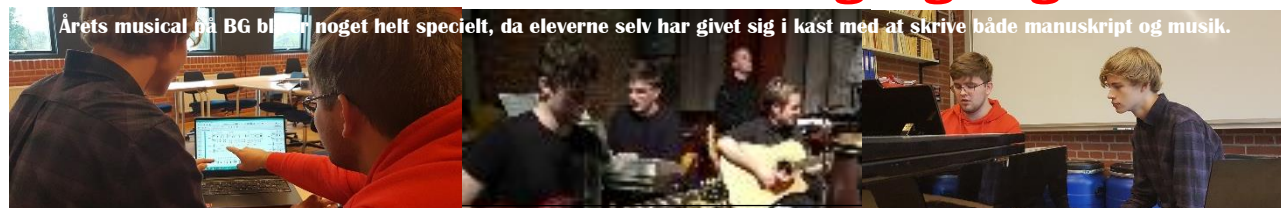
Årets musical på BG bliver noget helt specielt, da eleverne selv har givet sig i kast med at skrive både manuskript og musik.

Selvskreven BG-musical for første gang nogensinde!