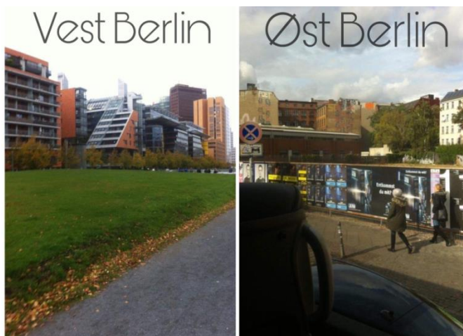
Til venstre ses vest Berlin i 2019, og til højre ses øst Berlin i 2019

de to ideologier ikke kunne nå til enighed, opførte den kommunistiske Sovjetunion en mur til at adskille deres befolkning fra vesten. Denne opdeling fik stor betydning for datidens samfund såvel som for