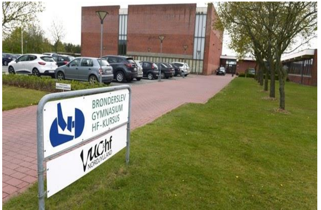
Et billede af Brønderslev Gymnasium og HF

Gymnasiet i Brønderslev, er ikke kun fuld af en masse engelsktimer, og bunkevis af afleveringer. For gymnasiet rummer også en masse latter, og ikke mindst en masse sjove hændelser. Både lærer og elever har haft deres uheldige og pinlige situationer, som de sent glemmer. Henholdsvis er to af gymnasiets lærer og en elev blevet interviewet, omkring deres mest akavet, sjove eller pinlige episoder i deres tid på gymnasiet.